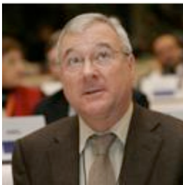
Ramón Luis Valcárcel Siso (ES/EPP)

První místopředseda Výboru regionů EU a předseda autonomní oblasti Murcia